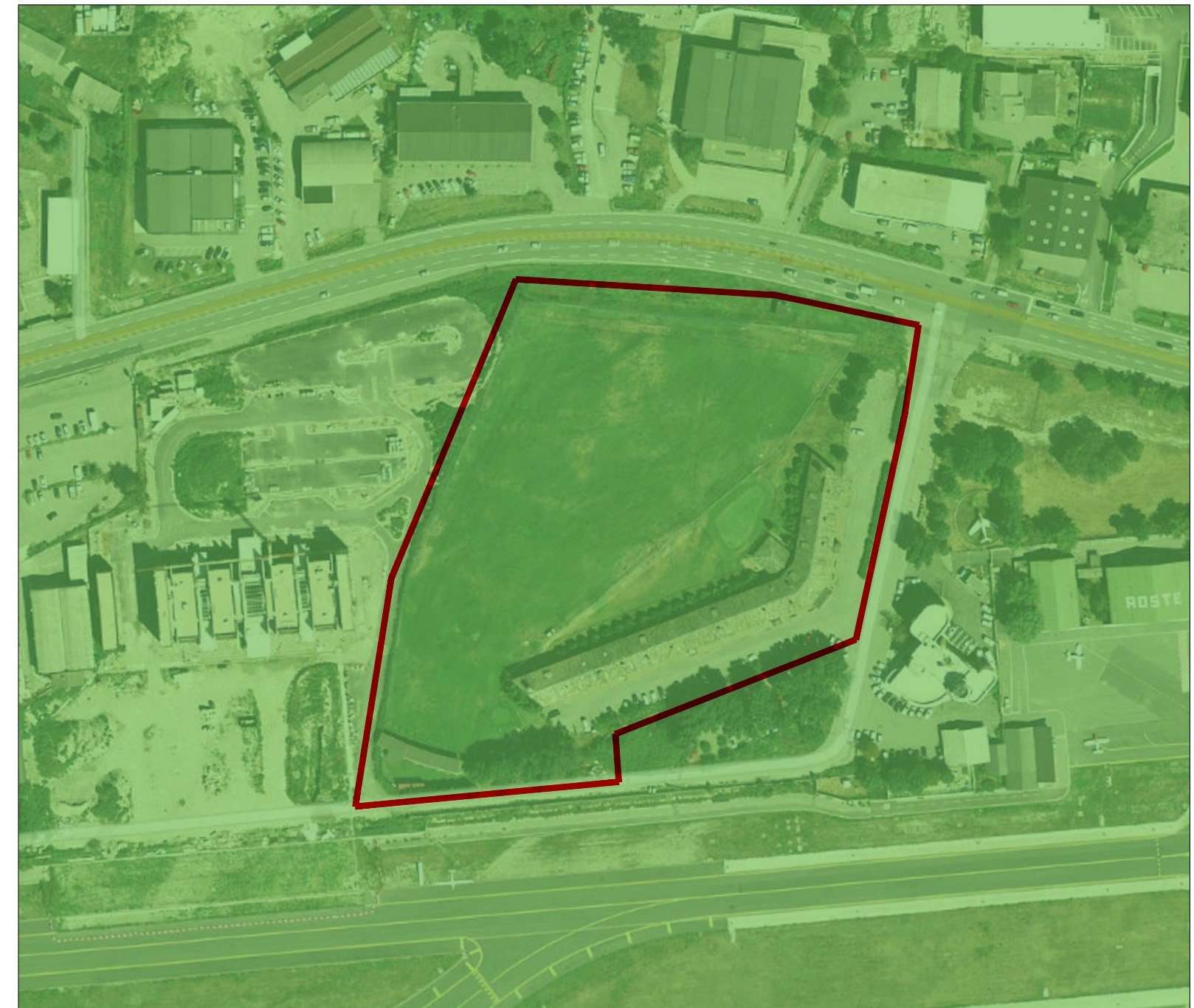
FC - Area di inondazione per piena catastrofica Ambiti inedificabili - Art. 36 L.r. 11/98 inondazioni